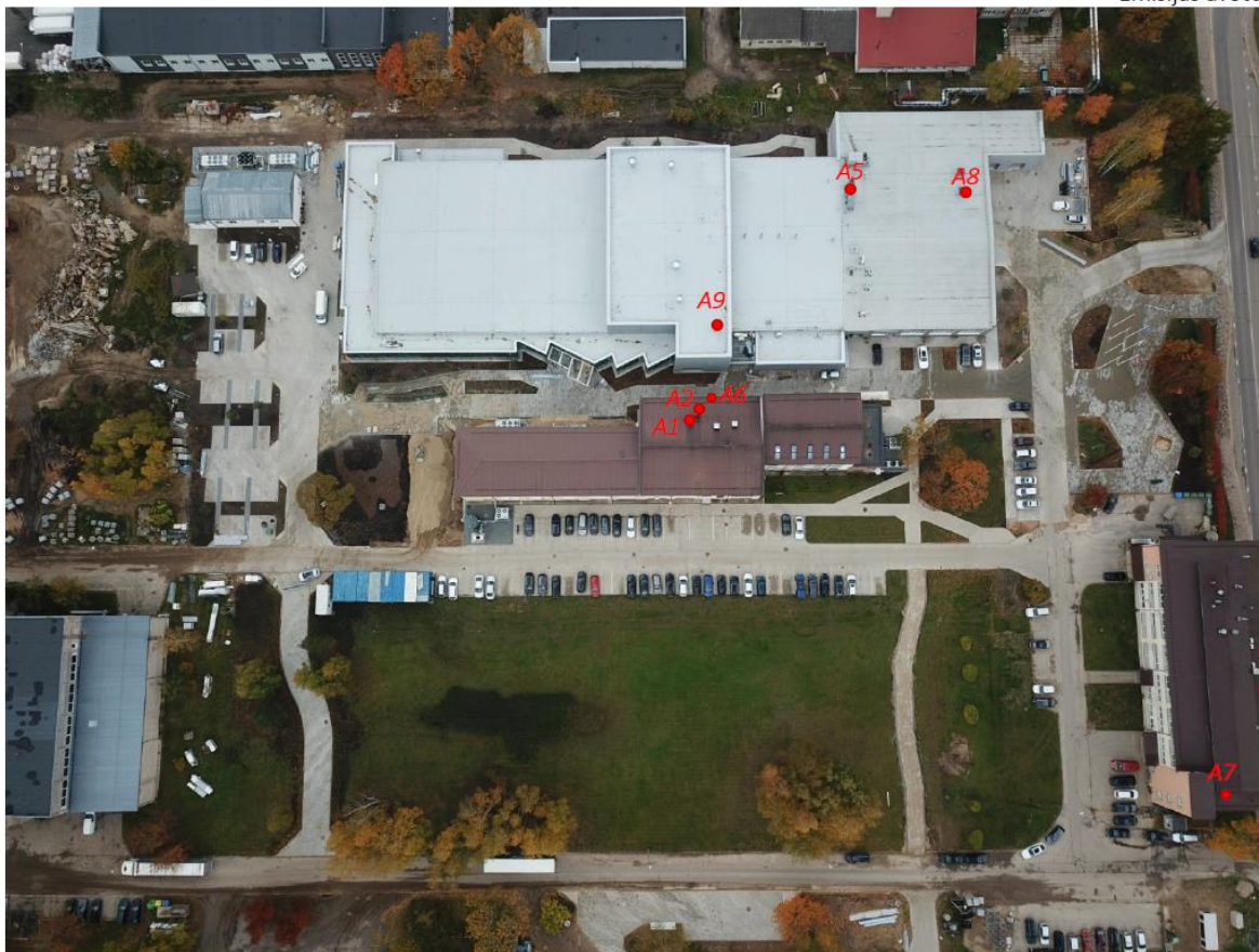
Emisijas avotu izvietojuma karte