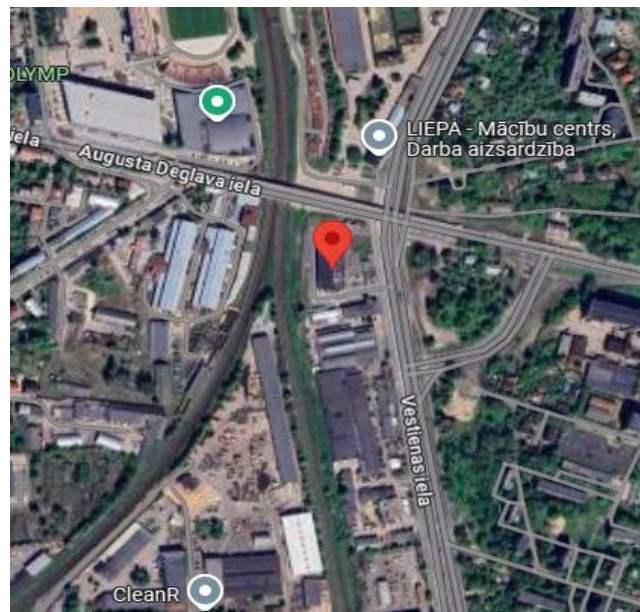
Ēku un emisijas avota novietojums uzņēmuma teritorijā